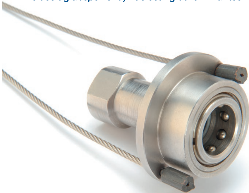
Serien DBG und HK

Beidseitig absperrend, Auslösung durch Drahtseilzug